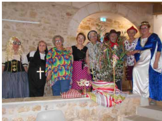
Notre repas de Mars était une réussite avec quelques déguisements